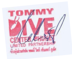
Tommy Ebert Tommy`s Divecenter Phuket

Ich verbleibe mit den allerbesten Grüßen und Wünschen aus Phuket