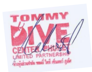
Tommy Ebert Tommy`s Divecenter Phuket

Ich verbleibe mit den allerbesten Grüßen und Wünschen aus Phuket